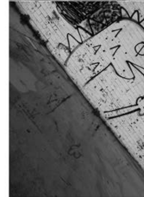
"Trinitat urbana": Iker Guzmán Campoverde

"La meva experiència amb la fotografia ha estat molt agradable. Vaig tenir un bon moment, un moment de llum. M'ha encantat fer les fotos."